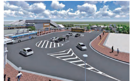
区画整理地区内駅前広場設計