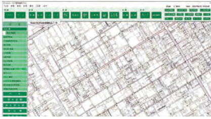
下水道台帳管理システム