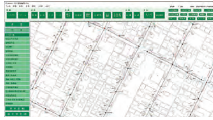
上水道台帳管理システム