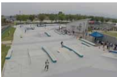
スケートパーク設計計画(中核市実績)