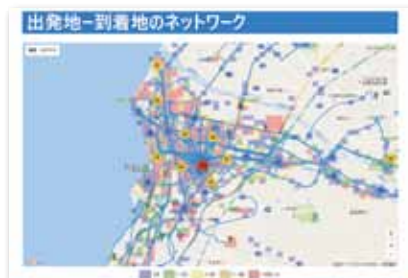
移動履歴の解析図(市実績)