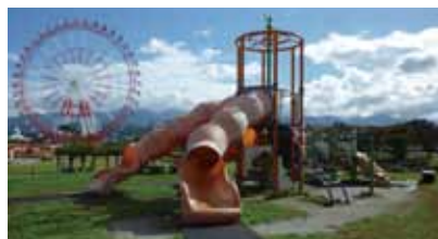
公園施設健全度調査、公園施設長寿命化計画策定(市実績)