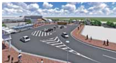
交通広場実施設計(土地区画整理組合実績)