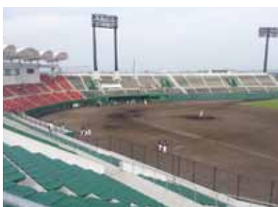
野球場設計計画(市実績)