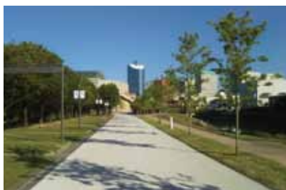
総合公園設計(県実績)