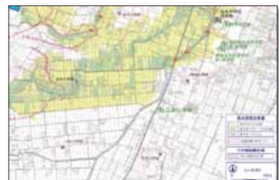
ハザードマップ(市実績)