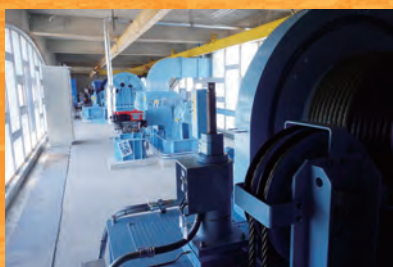
H30_荒川第1排水機場水門巻上げ機詳細ゲート更新設計(福井土木)