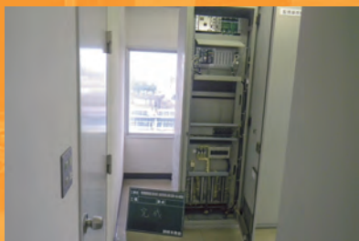
R3_中央地下道EV・EV室・電気防犯システム詳細設計(福井土木)