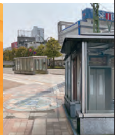
R3_中央地下道EV・EV室・電気防犯システム詳細設計(福井土木)