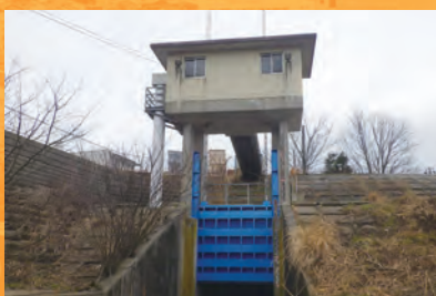
H29_荒川第1排水機場水門巻上げ機詳細ゲート更新設計(福井土木)