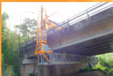
橋梁補修工事 設計業務委託 30-2