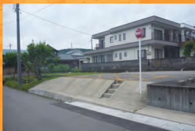
H30_耐震性貯水槽詳細設計(福井市)