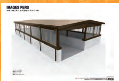
R2_中筋地下道上屋詳細設計(三国土木)