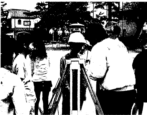
GPSでの身長測定を体験する児童 = 同小グラウンド