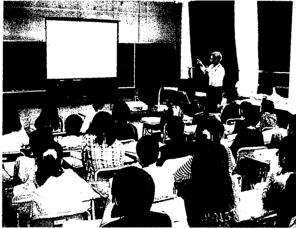
地図の重要性を学んだ地図教室 = 柳町小学校の教室