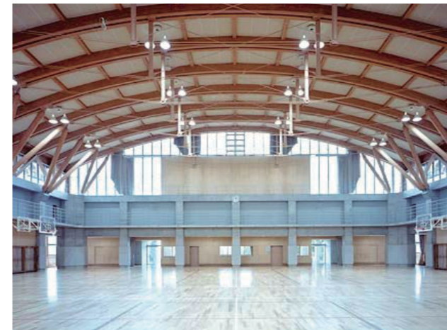
写真-1 木造屋根イメージ

建築の規模は、自然公園条例の規制により2000㎡以下とする必要があり、おおよそ65m×30mの規模とした。パーク部分は、中に柱を設けられないため、長スパンの荷重に耐えうる構造とする必要があった。このため1階は強度の高いRC構造を採用した。一方、整備方針で掲げた主要産業である「林業」をPRする建築とするため、2階及び屋根は木造とし、大規模な木構造を象徴的に用いた建築とした。